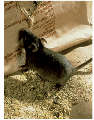
Spannmål är en favorit hos allätaren husmusen.

HUSMUSEN (MUS MUSCULUS) ÄR nästan helt knuten till miljöer där människor befinner sig. Den håller gärna till i väggar, på vindar eller under golv. Husmusen är en allätare men föredrar frön och spannmål. Kroppen hos en vuxen husmus är ungefär 8-9 cm lång och svansen är ca. 9 cm lång.