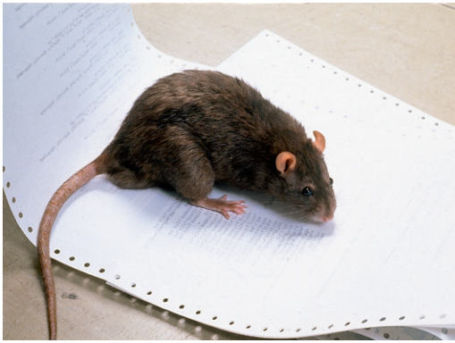
Brunrätten kan bli 20-30 cm lång, svans ej inräknad.