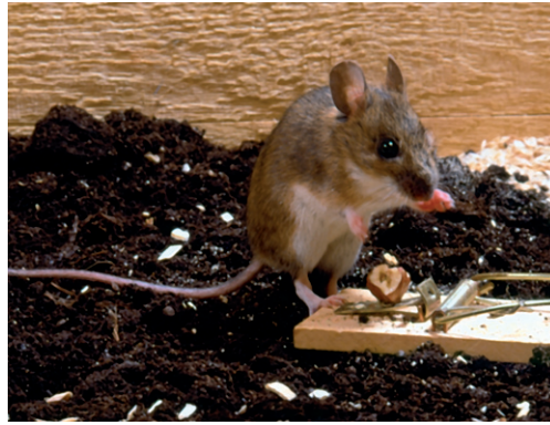
Skogsmusen söker gärna värme och mat inomhus när det är kallt ute.