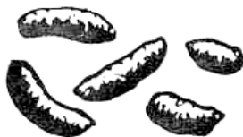
Brunrättans spillning (trubbiga, ca. 18 mm)

Brunråttorna gräver och gnager ut stora och långa gångsystem. I gångsystemen bygger de större kammare där de lägger upp matförråd eller har bon. Ett rättpar kan få mellan 800 och 1000 ättlingar per år. Eftersom ungarna är könsmogna och kan få ungar redan vid 2-4 månaders ålder, förökar sig råttorna mycket snabbt.